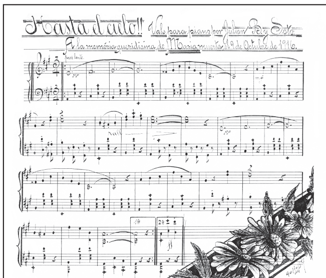
Imagen 4. Fragmento del tercero de los manuscritos del vals Hasta el cielo