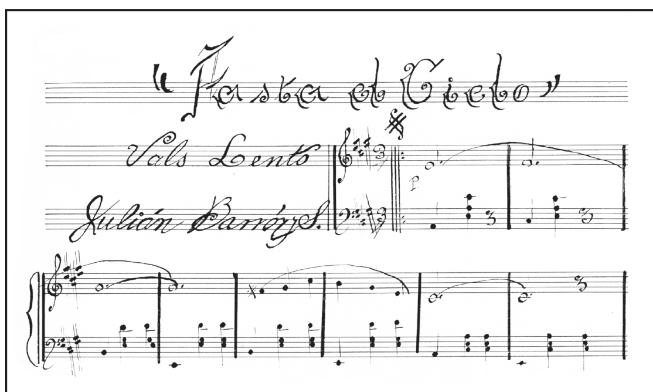
Imagen 2. Fragmento de uno de los manuscritos del vals Hasta el cielo