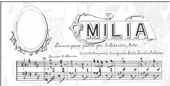
Imagen 1. Fragmento de la partitura manuscrita de Emilia