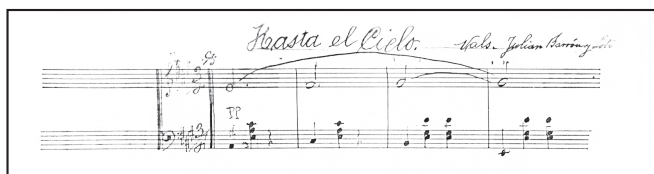
Imagen 3. Fragmento del segundo de los manuscritos del vals Hasta el cielo