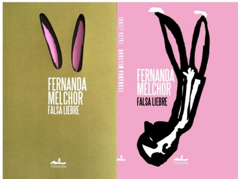
Anexo A. Portada de Falsa liebre (Almadía, 2013).