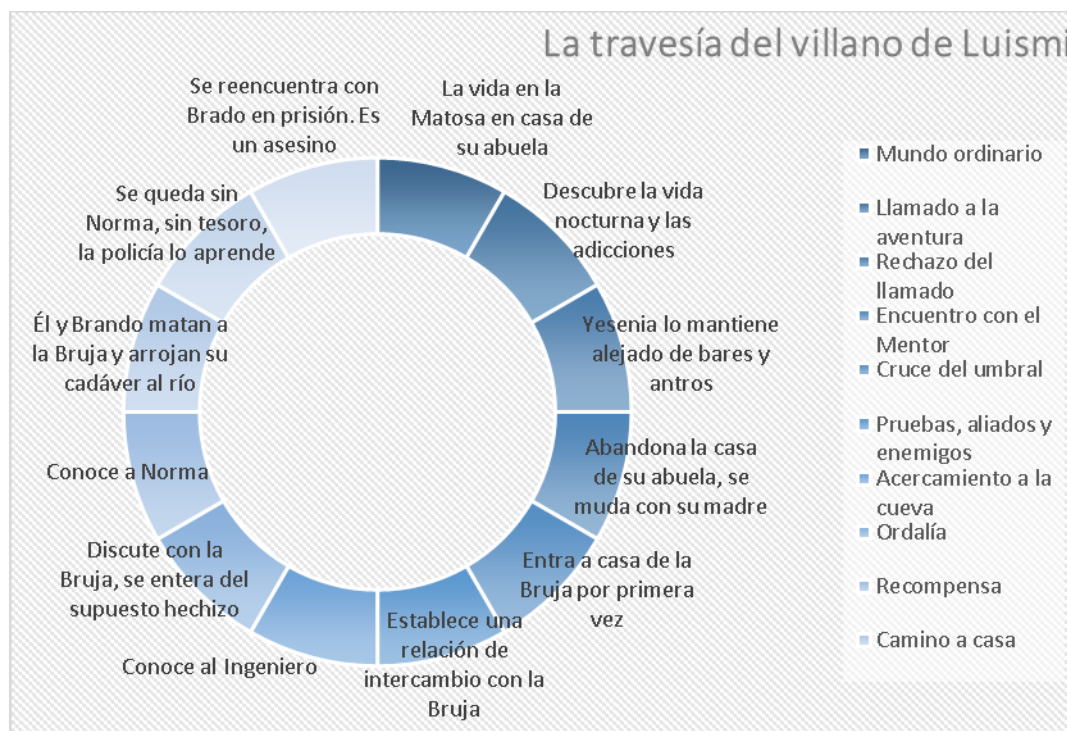
Etapas de la travesía del villano de Luismi.

termina, igual que Chabela, por ejercerlo como un intercambio. De la misma manera al matar a la Bruja, aunque con un estigma menor o inexistente, tal como su padre, se vuelve un asesino a traición.