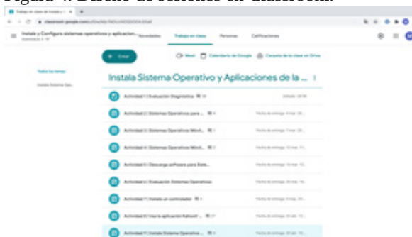
Figura 4. Diseño de sesiones en Classroom.

Nota: Classroom de ofimática, grupo “A” y “B”.