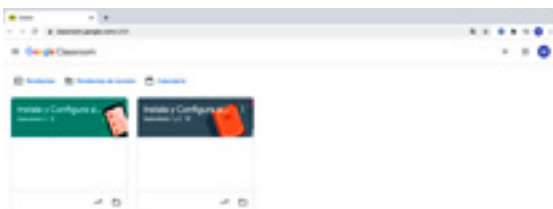
Figura 1. Diseño de las clases virtuales en la plataforma G-Suite.

Nota: Classroom de ofimática, grupo “A” y “B”.