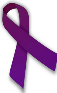
Figura 1. Símbolo de la lucha contra el bullying