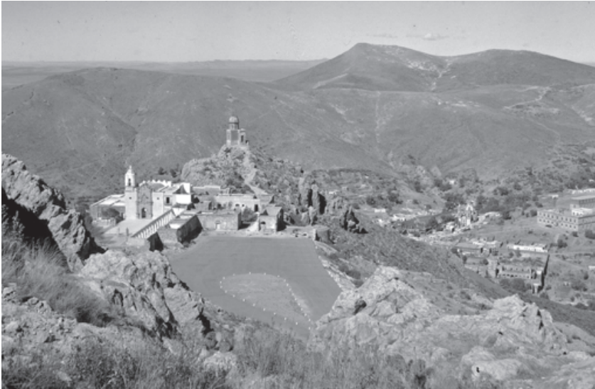
Al fondo el cerro alto de la Sierpe que en 1914 fue utilizado como fuerte o trinchera, con cercas de piedra. Y el cerro del Grillo, donde se alcanza a ver las fortificaciones en ruinas que sirvieron para la batalla de Zacatecas en 1914. Fotografía: José David Soto Calzada, 1950. Colección: Bernardo del Hoyo.