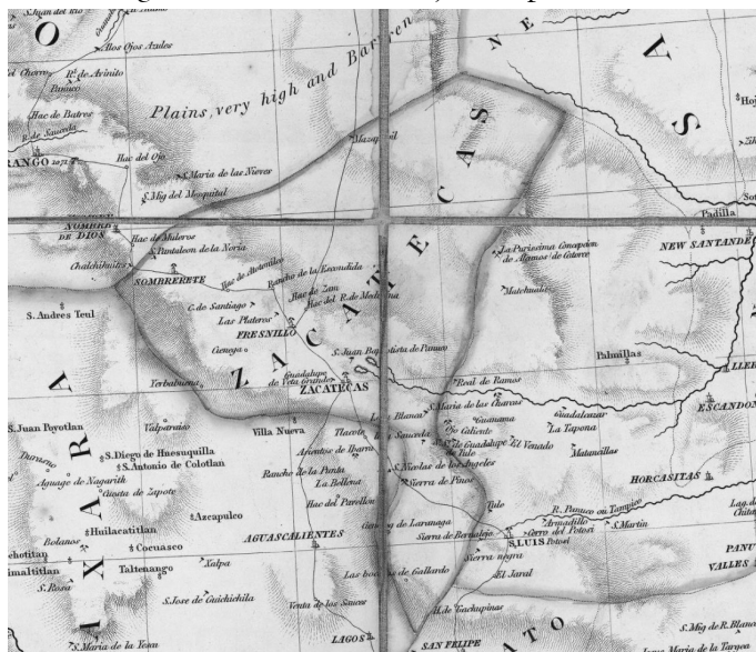
Figura 2. Mexico and adjacent provinces

Fuente: Alexander von Humboldt, 1810, London, 130 x 160 cm. Esc. 1: 2,450,000. Map in outline color, published by A. Arrowsmith (detalle).