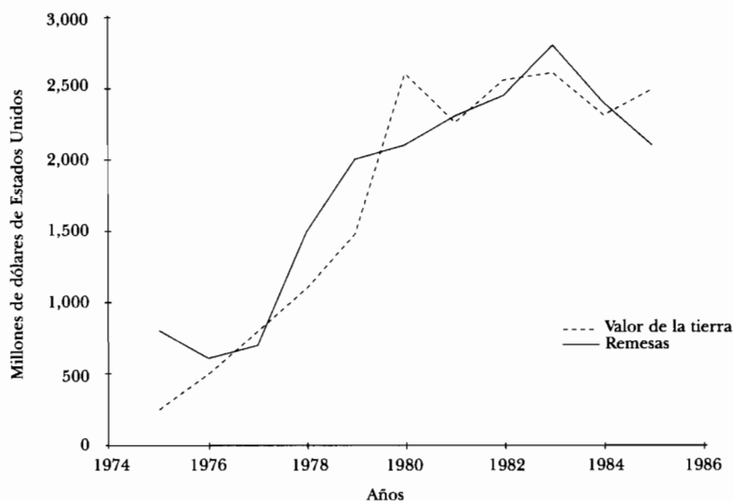
DESARROLLO DE LAS REMESAS Y PROMEDIO DEL PODER ADQUISITIVO POR UNIDAD DE TIERRA EN KERALA, 1975-1985