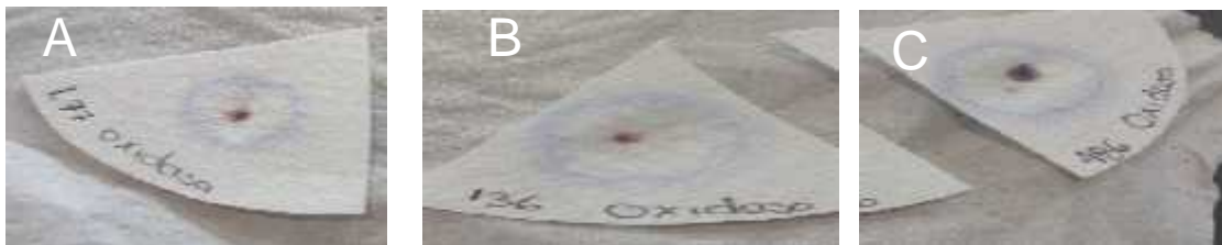
(A) Flor de junio UAZ L77, positivo a la prueba de Oxidasa, (B) Azufrado UAZ 136, catalasa oxidasa, (C) flor de junio UAZ 486 oxidasa positiva.