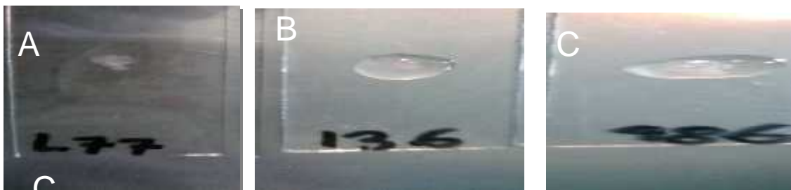
(A) Flor de junio UAZ L77, positivo a la prueba de catalasa, (B) Azufrado UAZ 136, catalasa positivo, (C) flor de junio UAZ 486 catalasa positiva