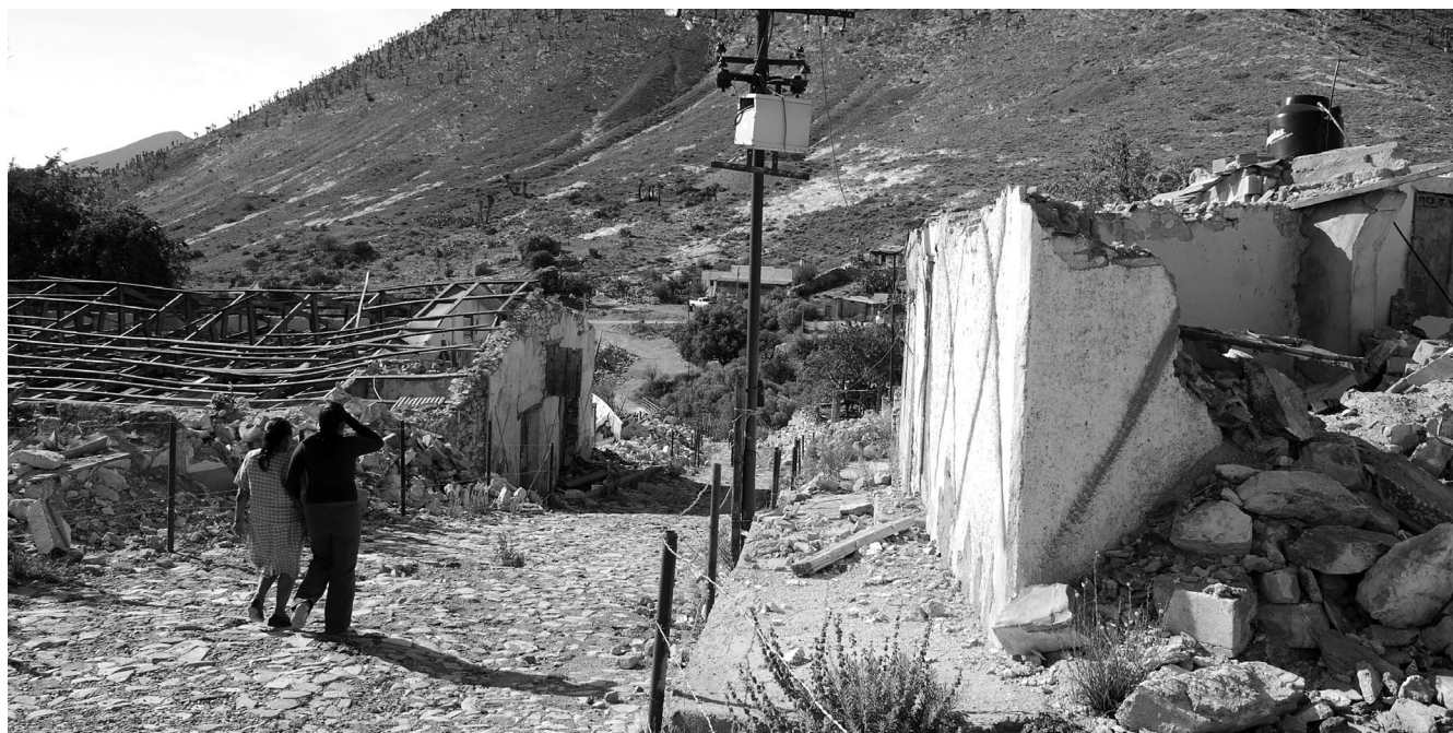
Habitantes de la localidad de Salaverna, Mazapil, Zac., fueron desalojados por presiones políticas y detonaciones subterráneas para permitir que la minera Tayahua, propiedad de Carlos Slim, pudiese extraer minerales del subsuelo.