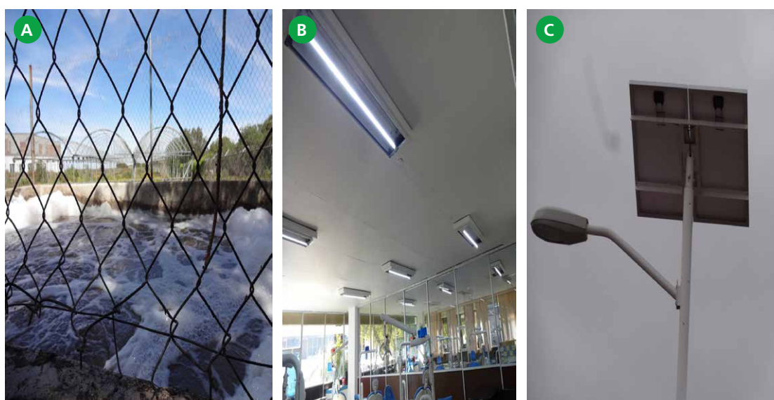
Figura 4. (A) Planta tratadora de aguas primera fase. (B) Utilización de lámparas ahorradoras en una clínica odontológica de la UAZ. (C) Lámpara con celdas solares.

1. Socialización de la estrategia, establecimiento de una agenda ambiental: Gestión Ambiental y Ambientalización de las Curriculas.