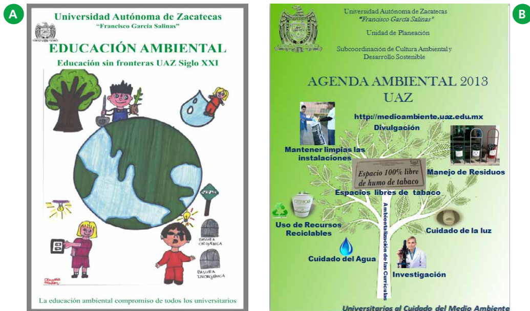
Figura 1. Agenda Ambiental UAZ. (A) Utilizada en 2006-2012, (B) 2013-2016.

prestigiadas del país. En ese año también se inició los estudios de Ingeniería.