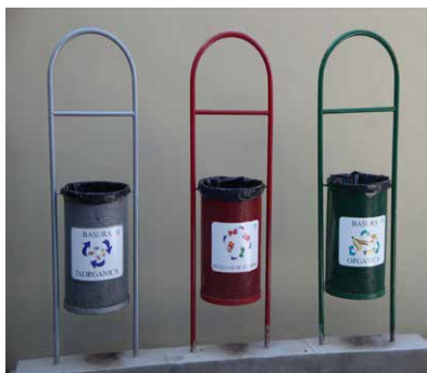
Figura 3. Contenedores instalados en todos los espacios universitarios para separación de residuos: aluminio, residuos inorgánicos y orgánicos.

un medio ambiente que les permita aspirar a una vida de calidad y digna.