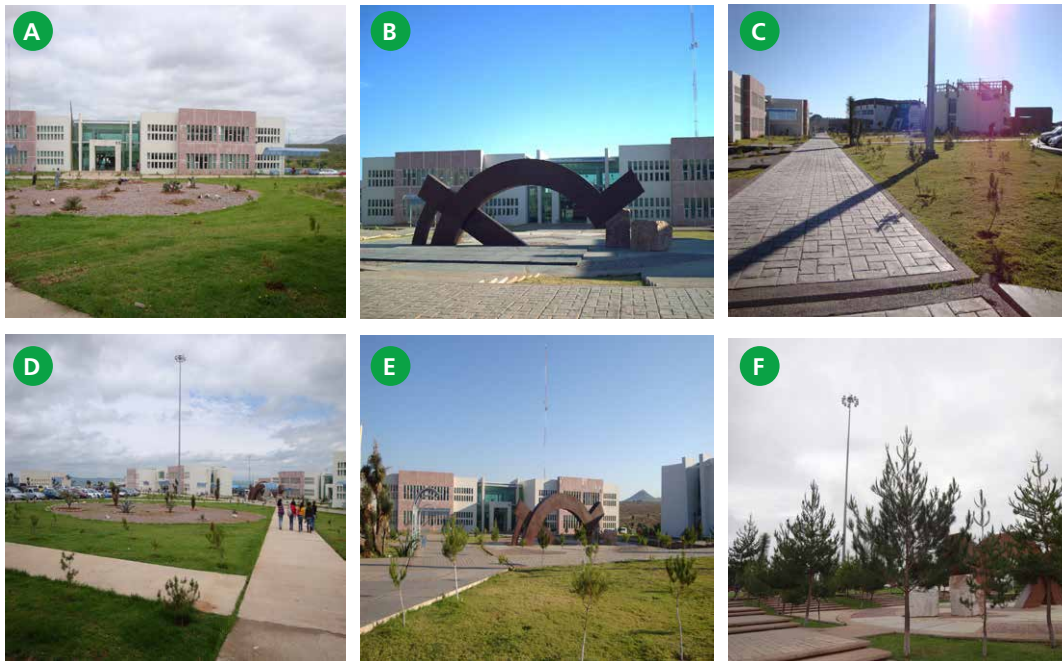
Figura 2. Evolución del desarrollo del proceso de forestación en el Campus UAZ Siglo XXI (2008-2016).

La Universidad Autónoma de Zacatecas siempre ha manifestado su intencionalidad en lo que se conoce como misión institucional, la cual consiste en educar y formar profesionistas emprendedores, responsables y honestos. Sustentada además, en una sólida formación humanística, científica, tecnológica y respetuosa del medio ambiente.