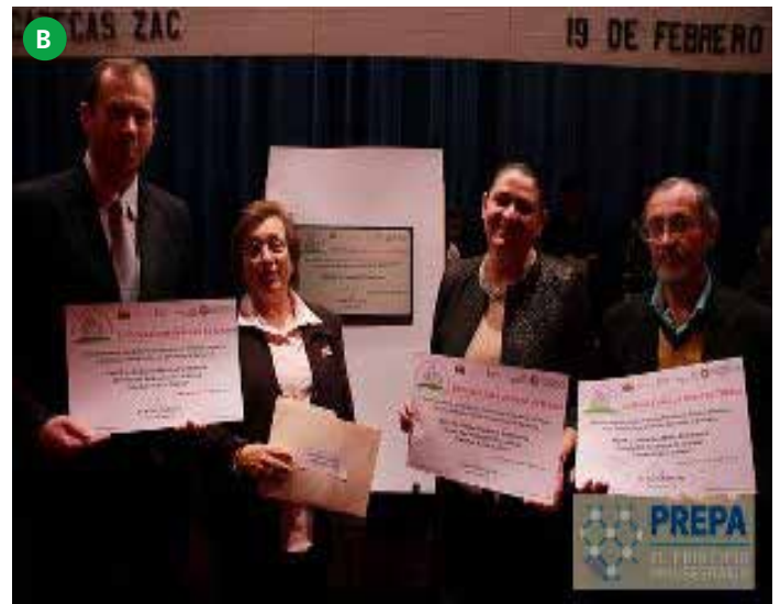
Figura 5. (A) Alumnos de guardería de la Universidad Autónoma de Zacatecas el día de su proceso de certificación como espacio 100% libre de humo de tabaco y (B) directores de unidades académicas de la UAZ el día de su certificación como espacios 100% libres de humo de tabaco.

2. Interacción de la educación formal (Realizar foros para fomentar el conocimiento sobre cambio climático y desarrollo sostenible, catalogo de investigadores de la UAZ que trabajen proyectos a favor del medio ambiente) y no formal en educación ambiental transversal para la formación integral de nuestros estudiantes, docentes y trabajadores.