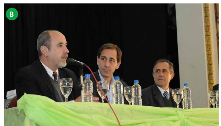
Figura 8. (A) Se muestra Figura de los libros publicados de los trabajos en extenso (2016) del cuarto congreso internacional de Cambio Climático y Desarrollo Sostenible en 2013. (B) Inauguración del quinto congreso internacional de Cambio Climático y Desarrollo Sostenible por el Presidente de la Universidad Nacional de la Plata el Dr. Raúl Perdomo en la Ciudad de la Plata Argentina, septiembre 2016.