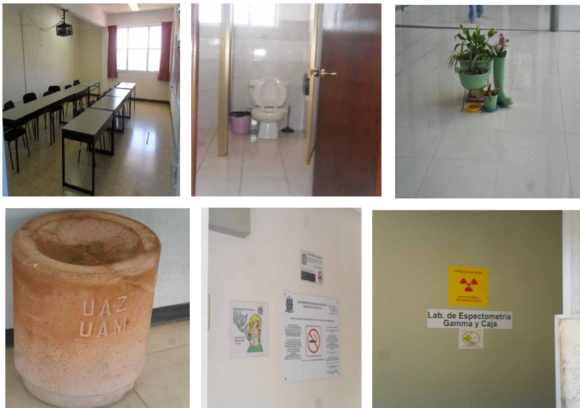
Figura 9. Se muestra una composición de imágenes de espacios limpios, señalética y vegetación.

Educar para el desarrollo sostenible significa incorporar los temas fundamentales del desarrollo sostenible a la enseñanza y el aprendizaje, por ejemplo: el cambio climático, la reducción del riesgo de